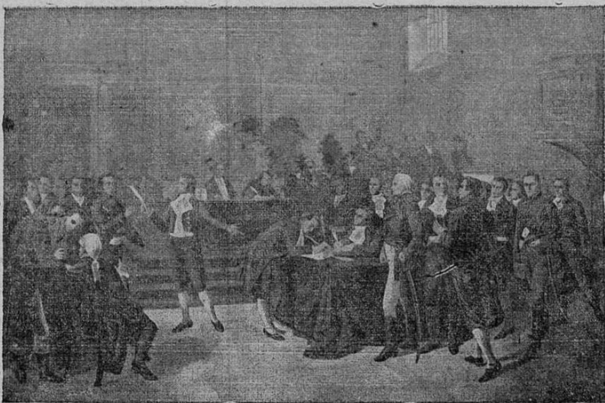
Firma del acta de Independencia.—(Cuadro del celebrado pintor venezolano Arturo Michelena)